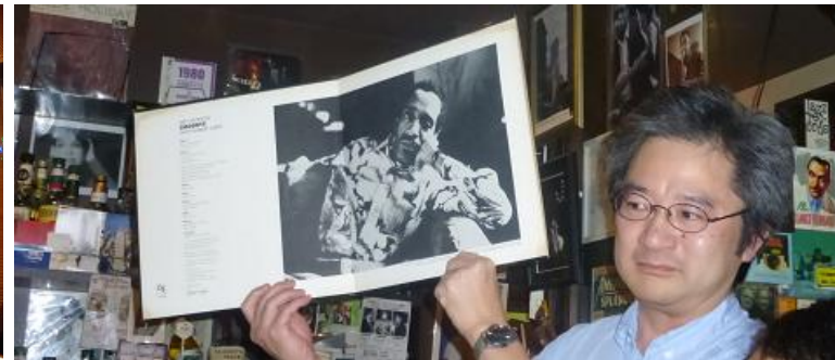
因みに、今回の最後のアルバムは・・・更に Milt Jackson の素顔です