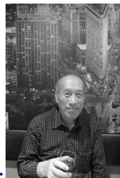
こうすると現地の写真！