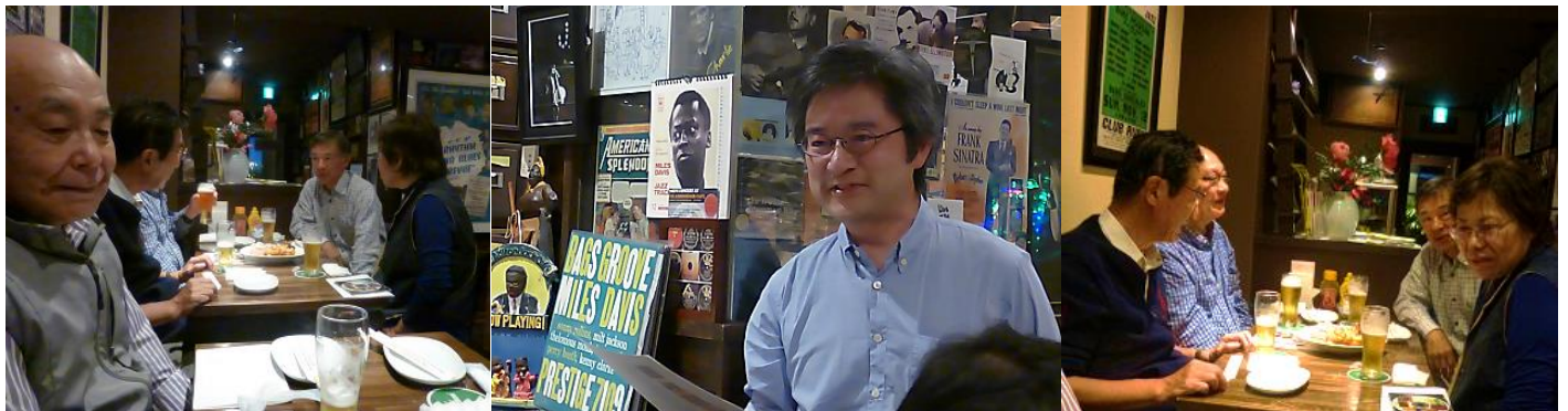
今日の LP の最初は MJQ Last Concert から “Softly As in a Morning Sunrise” を・・・