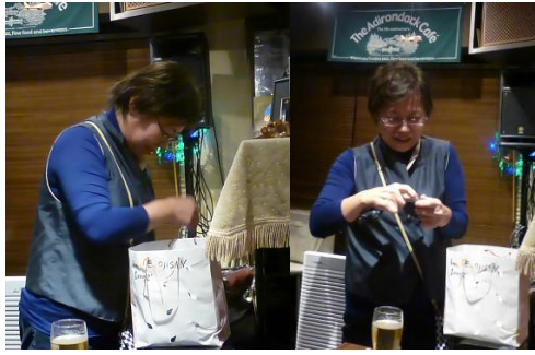
次は私から・・・これはジャンケンでないが・・・