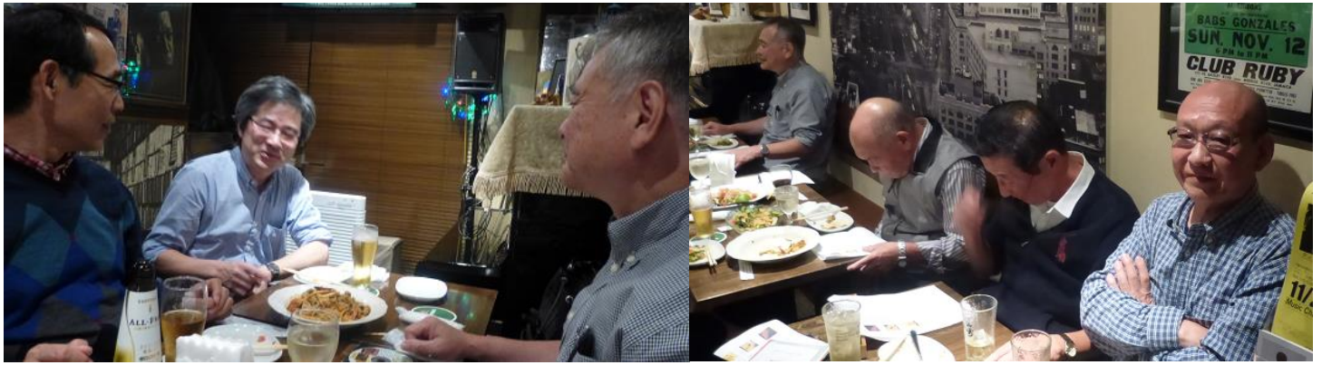
新たなメンバーが二人