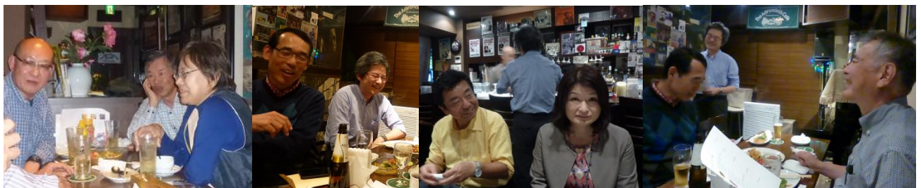
しばしリラックスしての歓談