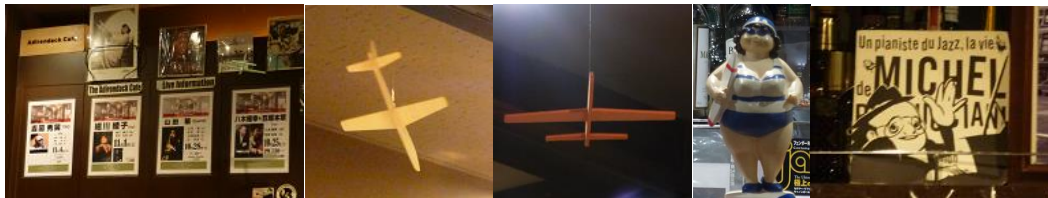
今回は “Milt Jackson の世界”で、先ずは乾杯!