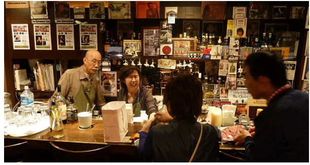
マスターご夫妻も気に入ったようで・・・