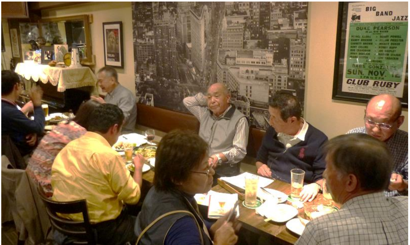
Jazzを聞いているのか・・・、話が目的か・・・、それとも酒？