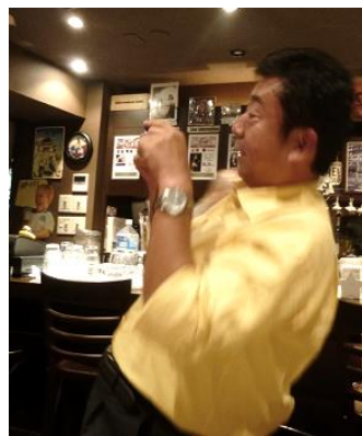
もう少し後ろでないと入らないか？