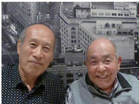
バックが白黒では写真だと解るが・・・