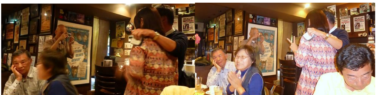
マスター！ こちらも撮って！