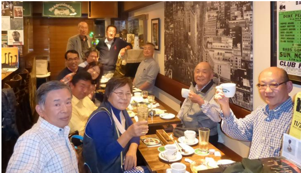
それでは時間も迫ってきたので、皆さんで記念写真を・・・