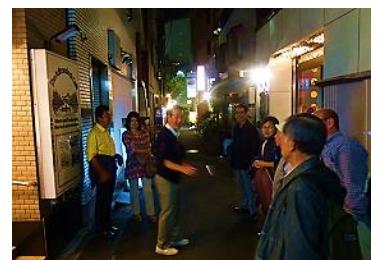
時刻は pm8:00 それでは次回また・・・！