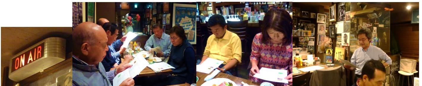
早速、ON AIR で