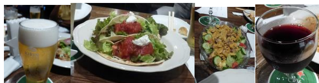
何時もの料理も美味しく・・・