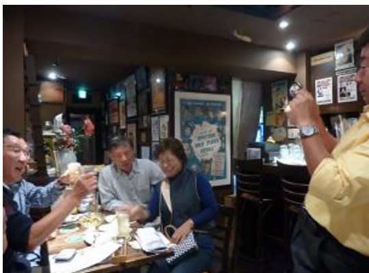
はいそれでは 記念写真を・・・