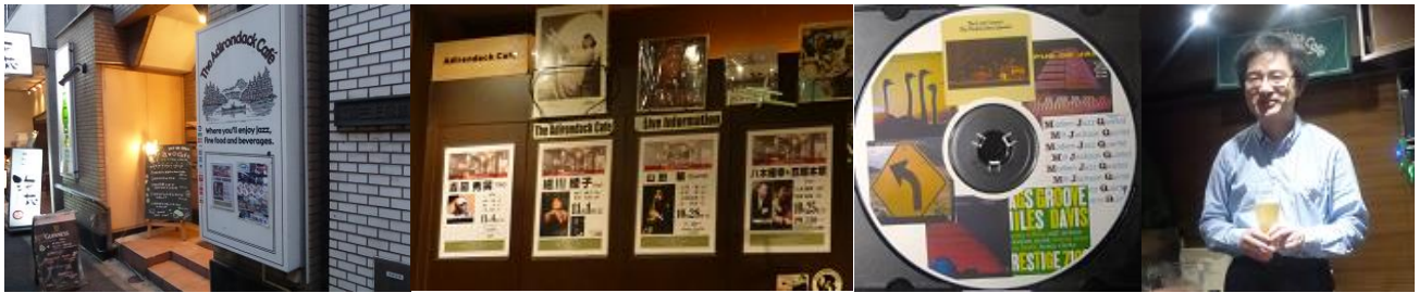
10月の17時そろそろ暗くなる頃...何時もの Adirondack Café にて...